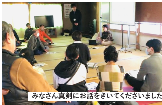
みなさん真剣にお話をきいてくださいました