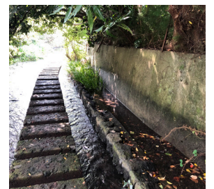
排水の浄化装置をそなえた「川の道」