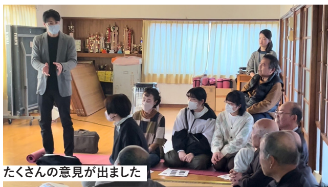
たくさんの意見が出ました