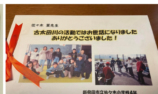
みなさんからいただいたリーフレット（左）とお手紙（右）