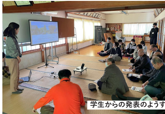
学生からの発表の様子