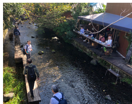
川沿いのカフェや川の中の散歩道

静岡県三島市では、汚れてしまった源兵衛川を再生させるため、市民団体「グラウンドワーク三島」が立ち上がりました。定期的な川掃除や水質調査、散歩道の整備などを行った結果、市民の憩いの場や子どもたちの遊び場となる川が再生しました。現在は、住民向けに「維持管理マニュアル」の作成や、源兵衛川以外の川でのビジョンづくりなど活動が広がっています。