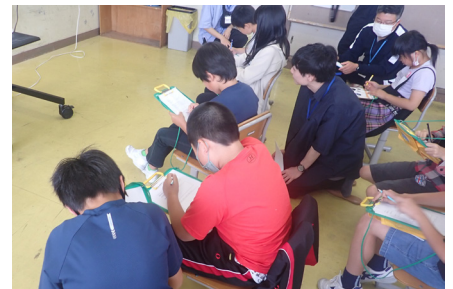
授業中の様子(佐々木小学校にて)