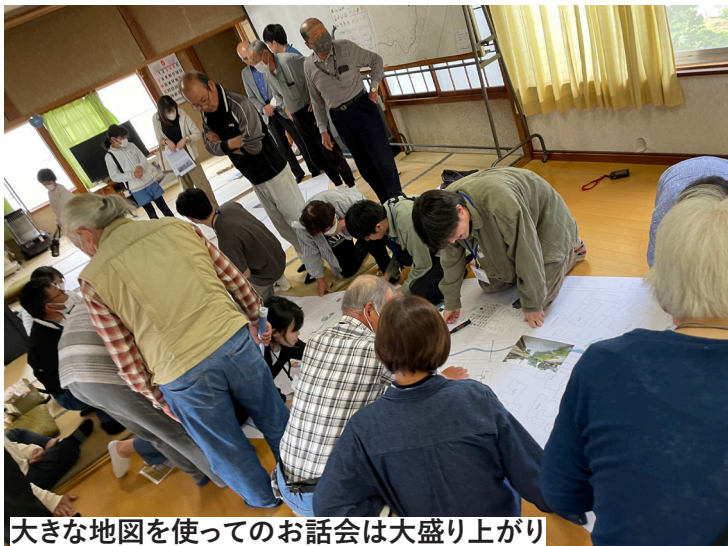
大きな地図を使っのお話会は大盛り上がり