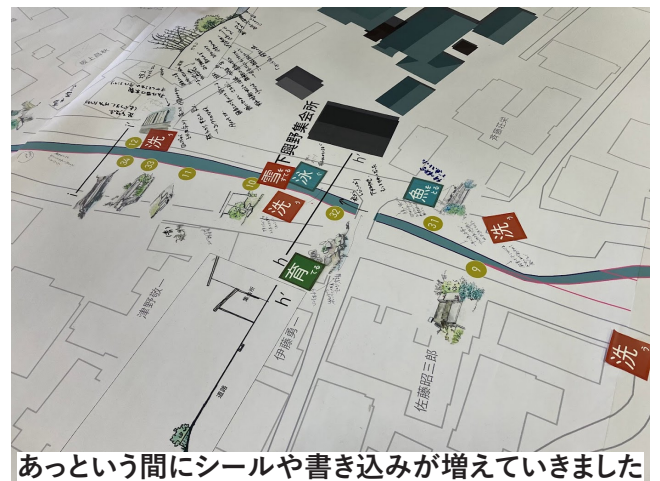
あっという間にシールや書き込みが増えていきました